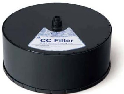
Photo. 2 CC Filter

以上の理由により、DWR1722 では、装置の小型化が可能な全量濾過方式を採用した。ただし、市販されているフィルタでは寿命が極端に短く実用的でない。そのため、ダイサ排水の濾過に特化した、専用のフィルタ「CC Filter」(写真 2) を独自開発した。CC Filter は独自構造の使い捨てフィルターモジュールである。このフィルタを採用したことで、非常に小さいフットプリントの中で純水リサイクル装置に必要な A~D のすべての機能を取めている。