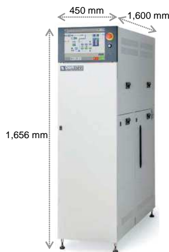
Photo. 1 DWR1722

そこで小型かつ高リサイクル率を実現した、ダイサ用超小型純水リサイクル装置「DWR1722」（写真 1）を開発した。